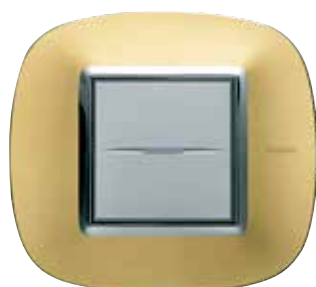
Gold mat - OSN