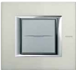
Brushed aluminium - XC