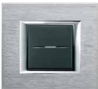
Brushed chrome - CR