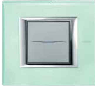
Kristall glass - VKA