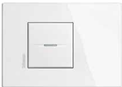
White - HD