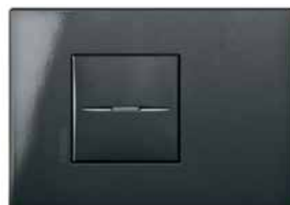
Graphite - HS