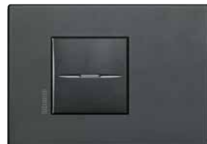
Eclipse - XN