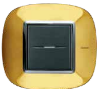
Shiny gold - OR