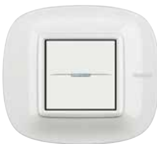
White - HD