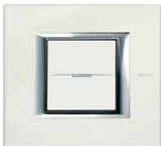
White Limoges - BG