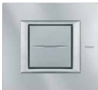
Tech - HC