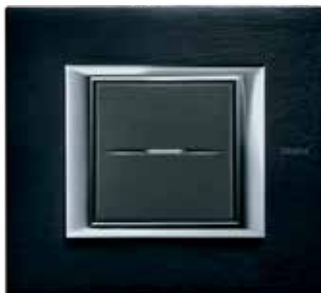
Brushed anthracite - XS