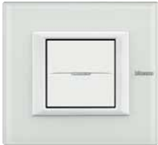
White glass - VBB