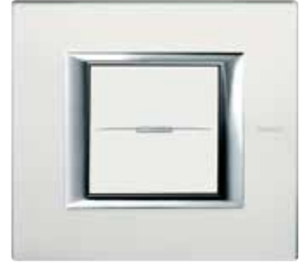
Mirror glass - VSA