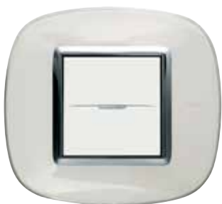
Liquid white - DB