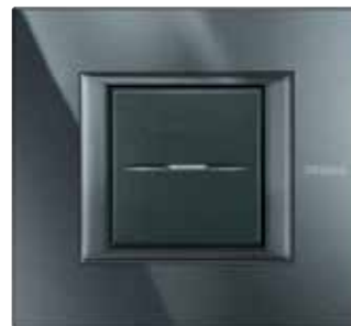
Anthracite - HS