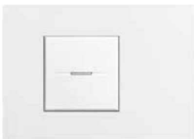
White Mat - AW