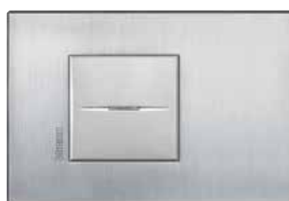
Chrome - CRS

Στις επόμενες σελίδες παρουσιάζονται οι τιμές 24 λειτουργιών: 1) σε πλαίσια Axolute τετράγωνα και ελλειπτικά 2 στοιχείων για συμβατική εγκατάσταση (με βάση στήριξης 2 στοιχείων με νύχια) 2) σε πλαίσια Axolute Air για μηχανισμούς 2 στοιχείων για ειδική εγκατάσταση (με βάση στήριξης 3 στοιχείων με βίδες) Για τις τιμές επιπλέον λειτουργιών ή συνδυασμούς λειτουργιών και τοποθέτηση σε πλαίσια περισσότερων στοιχείων, επικοινωνήστε με το Τμήμα Τεχνικής Υποστήριξης.