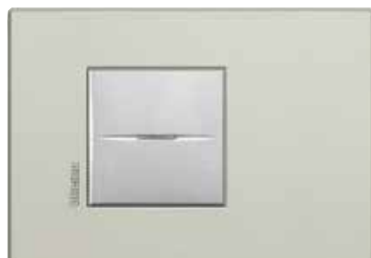
Sand - SB