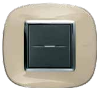
Liquid ivory - DA