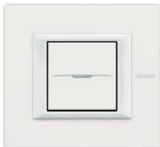
White - HD