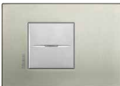
Titanium - TIS