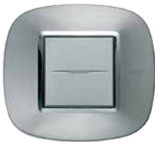
Aluminum - XC