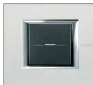
Silver - SAN