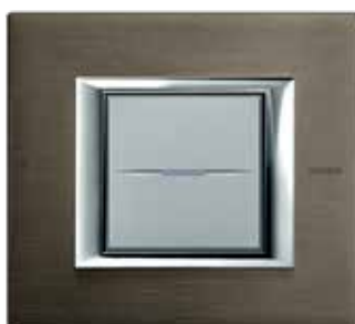
Brushed bronze - BR