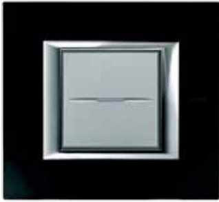
Black glass - VNN