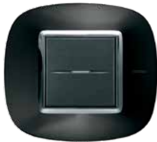
Anthracite - XS