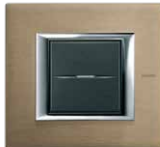
Brushed titanium - NX